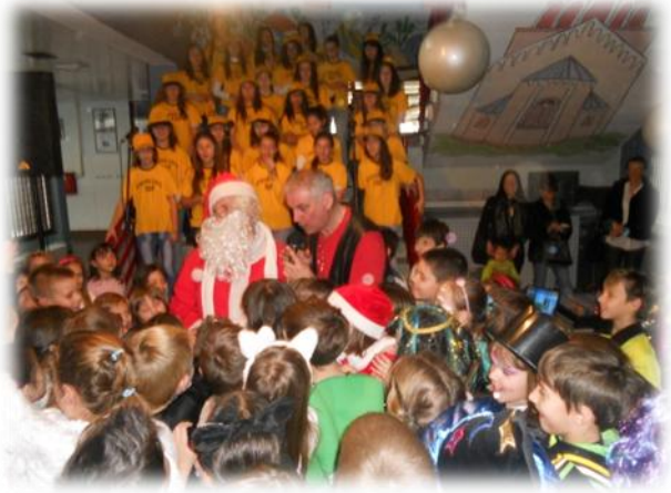
Program je upotpunjen i žurkom.