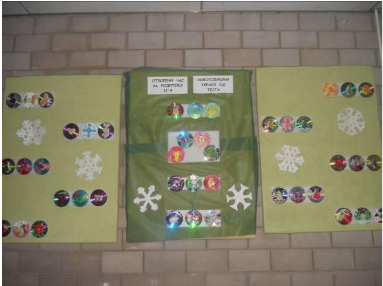
Učiteljica Tanja Vrečko