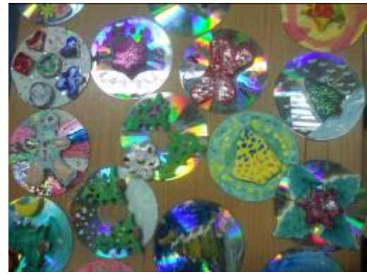
Radove smo izložili u holu škole.