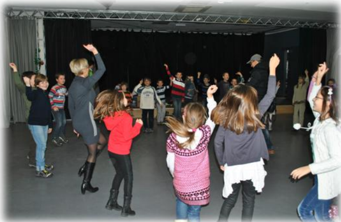
Ovim događajem odeljenje II-4 na najbolji mogući način završava 2013. godinu.